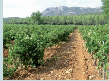
Le vignoble avec vue sur le Bessillon