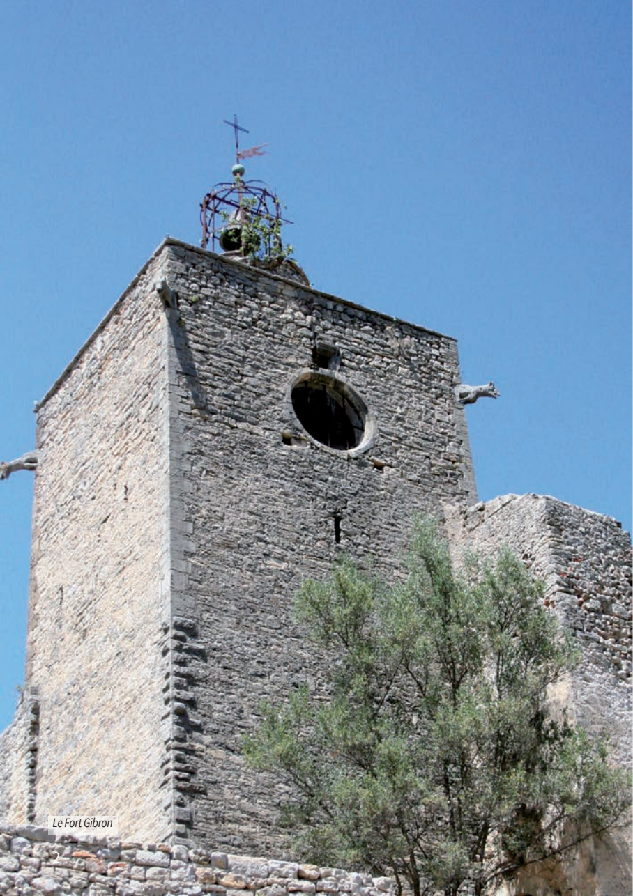
Le Fort Gibron

Le Pays d'art et d'histoire et l'Office de Tourisme Provence Verte & Verdon vous proposent de découvrir l'histoire, le patrimoine et les curiosités de leurs villages, au travers de cette brochure de la collection Parcours.