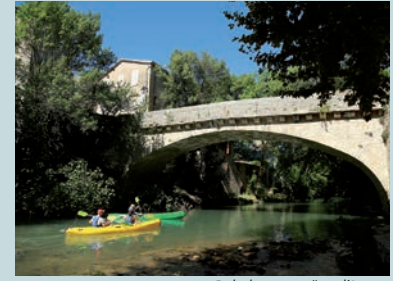
Balade en canoë sur l'Argens