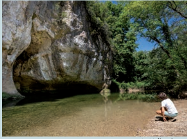
Le Vallon Sourn