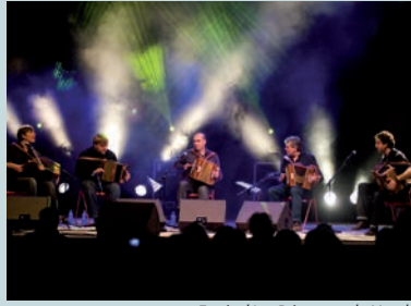
Festival Les Printemps du Monde