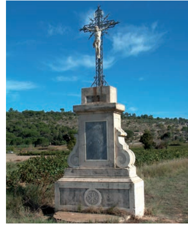
La croix du Plan