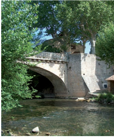
Le pont en pierre et l'Argens