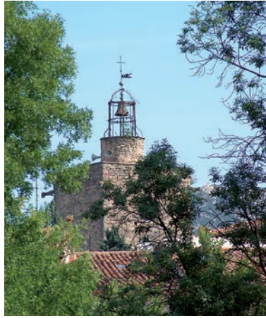
Le campanile du Fort Gibron