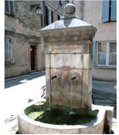
La fontaine de la place