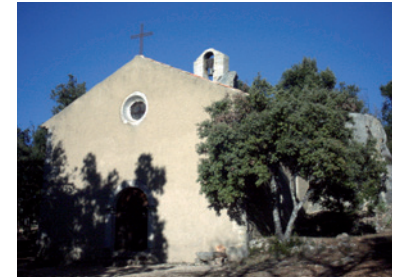
Notre-Dame de Bellevue

Au haut Moyen Âge, il semble que l'abbaye Saint-Victor de Marseille ait eu à Tavernes une colonica , c'est-à-dire une exploitation rurale. Le site est mentionné au XI e siècle comme une villa à l'habitat dispersé important. Aux siècles suivants, la communauté se regroupe à l'intérieur d'une enceinte, autour de l'église Saint-Cassien, puis se développe à partir du XV e siècle. Dès 1252, les Pontevès possèdent la moitié du castrum, l'autre moitié étant partagée entre les Cadarache et les comtes de Provence. Au cours de l'histoire, la seigneurie passe entre différentes mains jusqu'au duc de Bourbon qui en est le dernier seigneur.