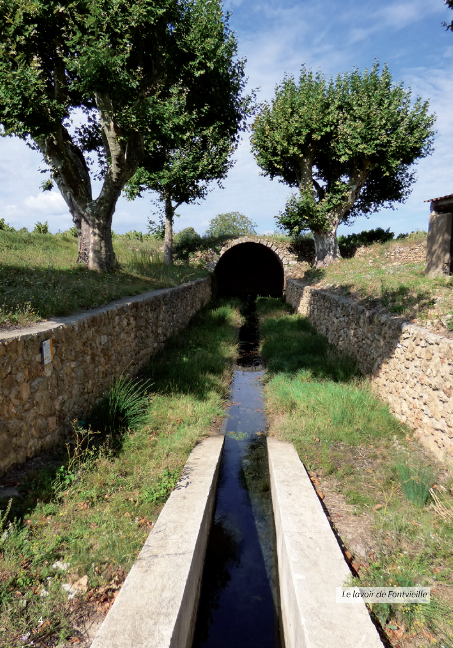
Le lavoir de Fontvieille