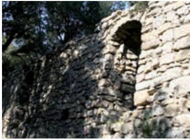
Le four à cade