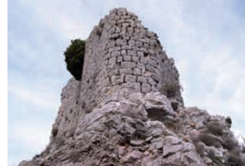
Les ruines du château médiéval