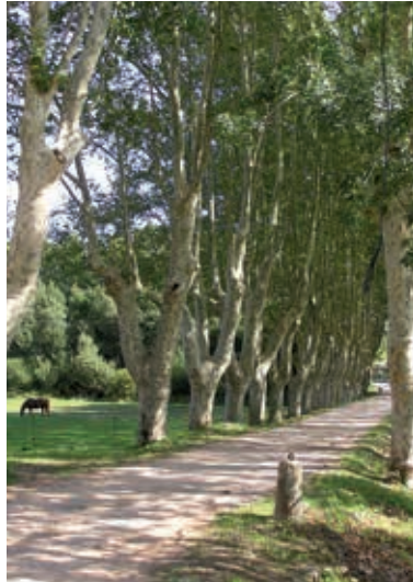
Le Domaine de La Pességière

Rocbaron est reconnu pour son ciel étoilé et son centre d'observation astronomique. Installé au domaine de la Verrerie, il propose de contempler les astres à l'aide de l'une des plus grandes lunettes astronomiques professionnelles d'Europe.