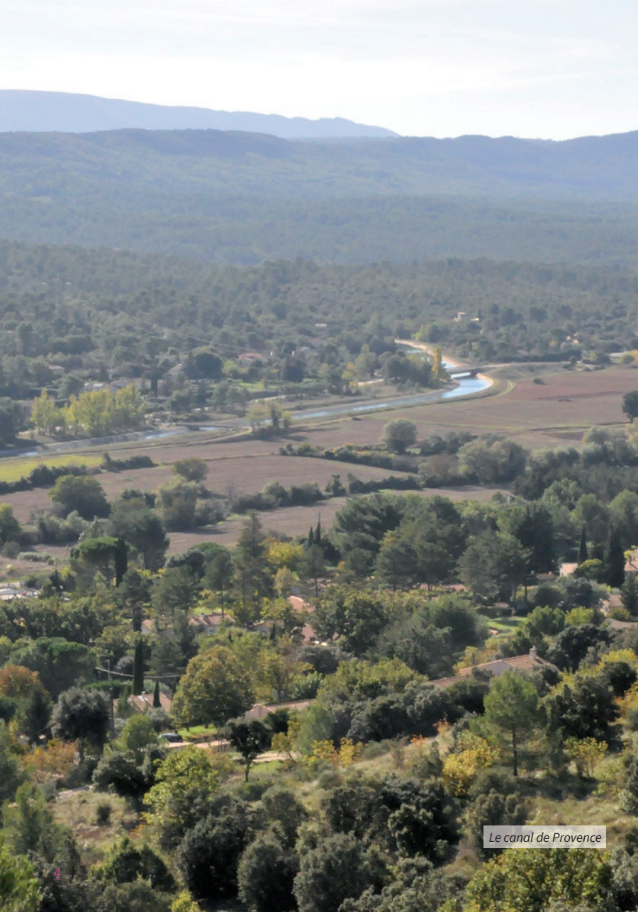
Le canal de Provence