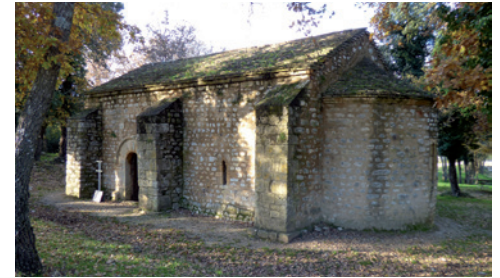
La chapelle Saint-Estève