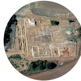
La villa des Toulons