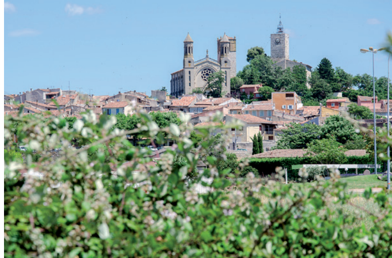
Vue du village