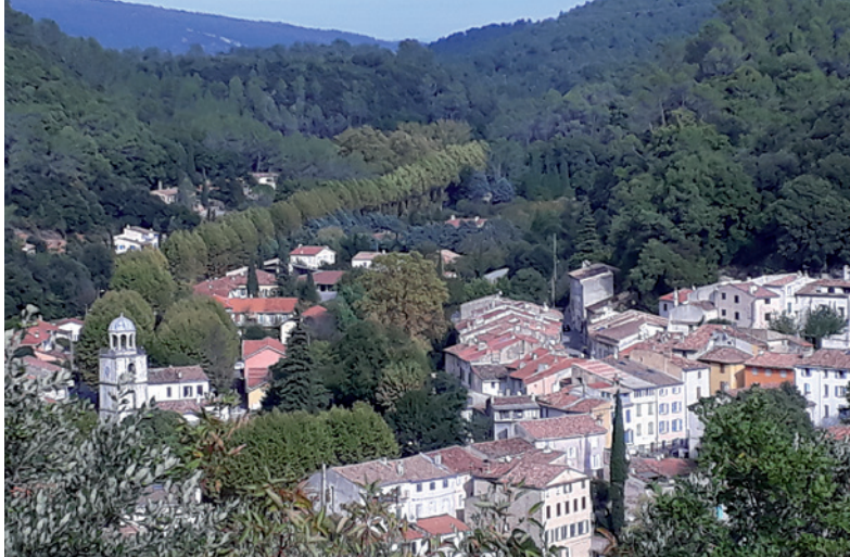
Vue du village