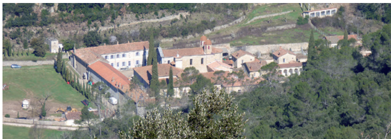
Chartreuse Notre-Dame de Montrieux

Parcouru par le Gapeau, le Naï et la Lône, Méounes est marqué par la présence de l'eau, qui a favorisé le développement d'activités agricoles et artisanales. Le cadastre napoléonien y mentionne, au XIX e siècle, un moulin à huile, deux moulins à farine, un moulin à tan, trois fabriques de papier, deux tanneries, une plâtrière et une fabrique d'eau-de-vie.